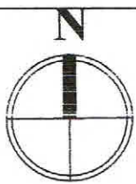
СХЕМА ВНЕШНЕГО ИНЖЕНЕРНО-ТЕХНИЧЕСКОГО ОБЕСПЕЧЕНИЯ ТЕРРИТОРИИ 1:2000